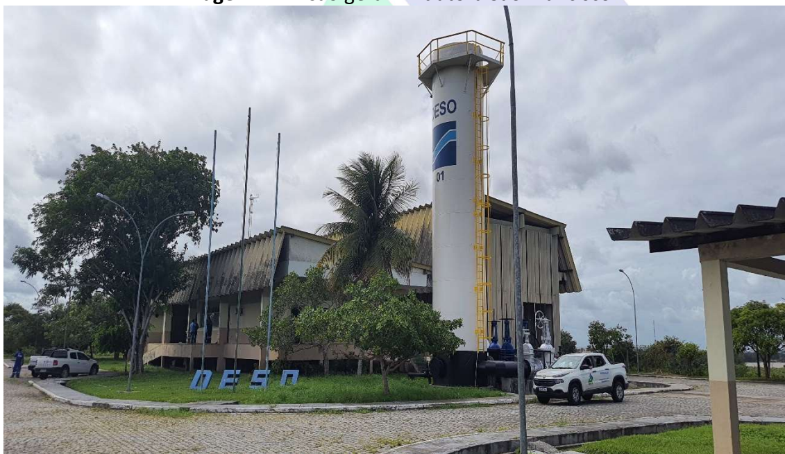
Imagem 1 – Visão geral – Adutora São Francisco.

O Sistema de Captação da Adutora São Francisco, localizado no município de Telha/SE, capta atualmente cerca de 9.500 m 3 /h de água, sendo responsável pelo abastecimento de aproximadamente 80% da região metropolitana de Aracaju. O Sistema realiza a captação de água no Manancial São Francisco e adução à ETA João Ednaldo, localizada no município de Nossa Senhora do Socorro/SE, onde é realizado o tratamento da água para posterior distribuição à população (Imagens 1 – 5).