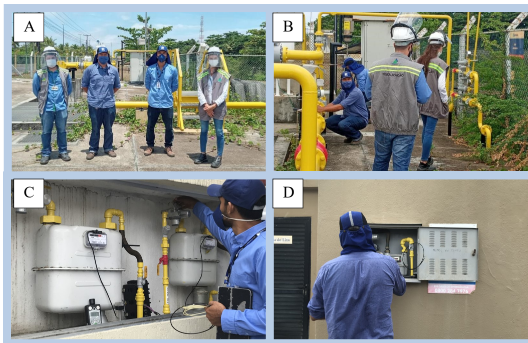
Figura 1: Fiscalização na ETC Atalaia. E CRM's

Conforme Tabela 1 e Figura 1, no mês de novembro foram vistoriados o o sistema de odoração da rede de distribuição na cidade de Aracaju, a qual é realizada na ETC Atalaia (Figura 1A e 1B), sendo os efeitos dos ajustes verificados nos pontos de entrega, nos consumidores (Figura 1C e 1D).