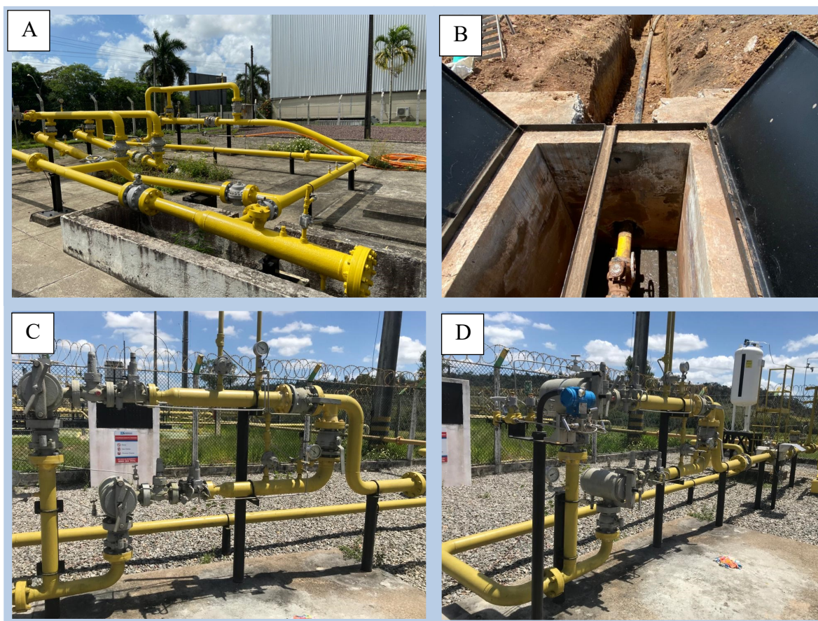
Figura 2: Fiscalização na ERPM, ERP e ETC.

Conforme Tabela 2 e Figura 2, no mês de novembro foi acompanhado o serviço de manutenção no trecho entre a ERP Die II e na ERPM IVN localizados no município de Estância, com a inspeção estrutural na ERP e substituição dos flanges das válvulas da rede no trecho (Figura 2A e B). Também foi acompanhada a troca de tramos A e B, inspeção de filtro e odoração na ETC localizada em Carmópolis (Figura 2C e 2D).