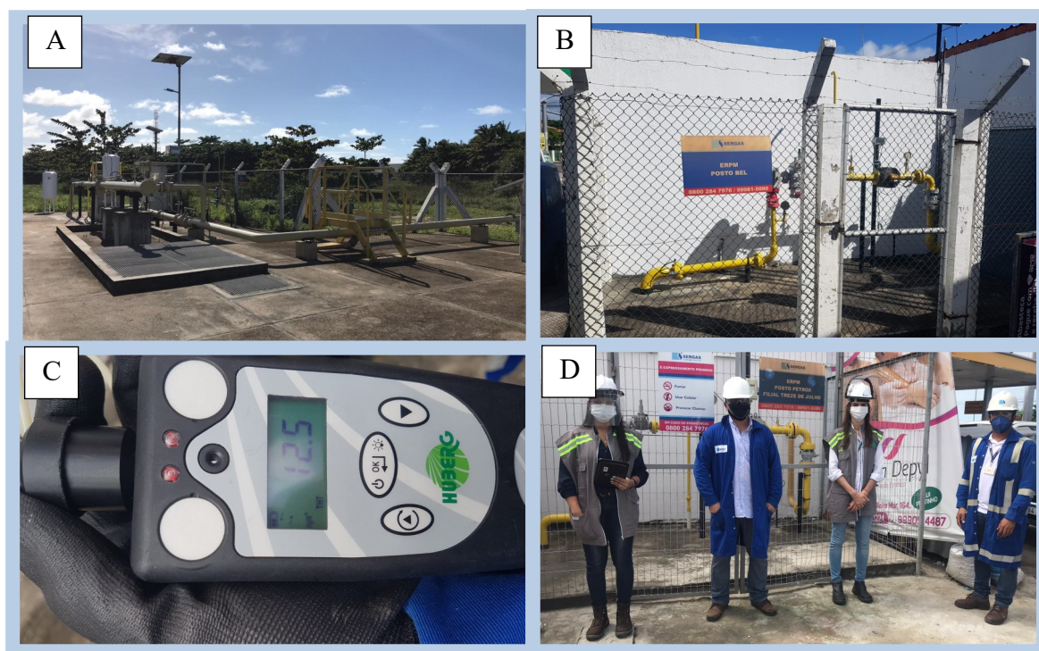
Figura 1: Fiscalização nas ETC's, e ERPM's setores residenciais e comerciais.

Conforme Tabela 1 e Figura 1, no mês de julho foram vistoriados o o sistema de odoração da rede de distribuição na cidade de aracaju, a qual é realizada na ETC Atalaia (Figura 1A), sendo os efeitos dos ajustes verificados nos pontos de entrega, nos consumidores ( Figura 1B, 1C e 1D).