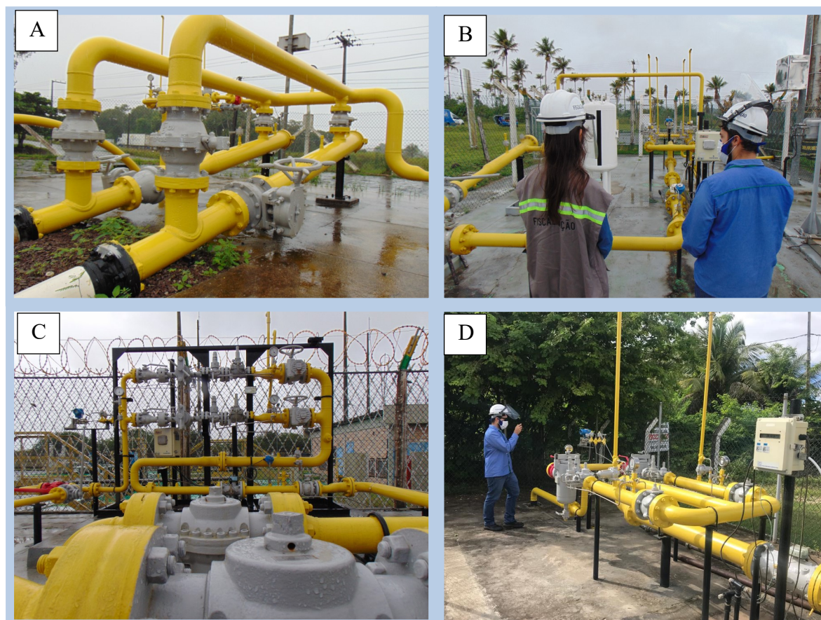
Figura 2: Fiscalização nas ETC's e ERPM's

Conforme Tabela 2 e Figura 2, no mês de julho foram acompanhadas as coletas de gás para análise da concentração de odorante em alguns pontos do sistema de distribuição como a exemplo da ERP DIE II e ERP AMBEV (Figura 2A e 2D) bem como a verificação do sistema de odoração na ETC Estância e ETC Águas Claras (Figura 2 B e C).