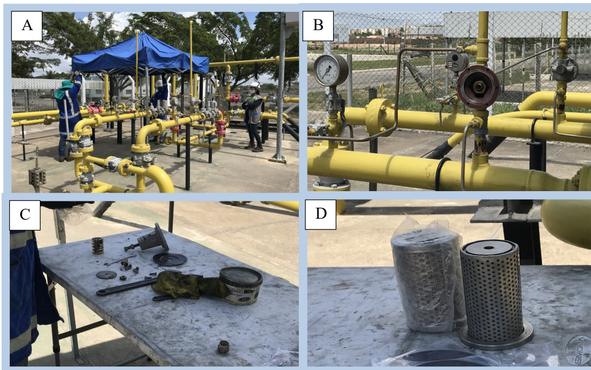
Figura 1: Fiscalização na ERP DIE I e II

Conforme Tabela 1e Figura 1, no mês de março foi vistoriado serviço de manutenção preventiva na estação de regulação e pressão - ERP DIE I e II localizado no município de Socorro, (Figura 1A). Na presente atividade, foram substituídos os componentes da válvula de alívio, (Figura 1B e 1C) e os filtros das duas linhas (Figura 1D) ou tramos da estação.