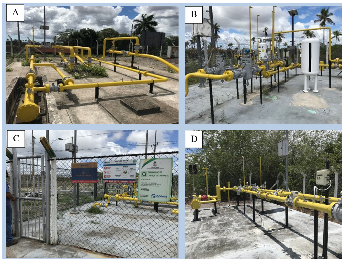
Figura 2: Fiscalização nas ETC's, ERP's e CRM's.

Conforme Tabela 2 e Figura 2, no mês de fevereiro foram acompanhadas as coletas de gás para análise da concentração de odorante em alguns pontos do sistema de distribuição como a exemplo da ERP DIE II e ERP AMBEV (Figura 2D) bem como a verificação do sistema de odoração na ETC Estância e ETC Águas Claras (Figura 2 B e C).