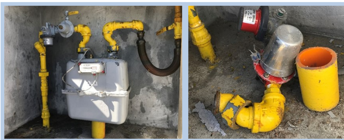
Figura 3: Acompanhamento da troca do AP-40 no Conjunto Regulador e Medidor.

Conforme Tabela 3 e Figura 3, no mês de fevereiro foi acompanhado o serviço de substituição do regulador de gás AP-40 encontrados nos conjuntos de regulagem e medição - CRM dos consumidores do segmento comercial e residencial .