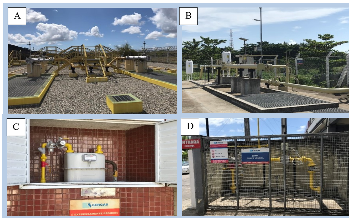
Figura 1: Fiscalização nas ETC's, ERPM's e CRM's dos setores residenciais e comerciais.

Conforme Tabela 1 e Figura 1, no mês de fevereiro foram vistoriados o sistema de odoração na ETC Carmópolis, localizada no município de mesmo nome (Figura 1A), e também no sistema de odoração da rede de distribuição na cidade de Aracaju, a qual é realizada na ETC Atalaia (Figura 1B), sendo os efeitos dos ajustes verificados nos pontos de entrega, nos consumidores (Figura 1C e 1D).