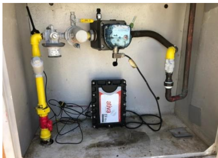
Figura 1: Conjunto de Regulagem e Medição

As figuras 1 a 4 ilustram as atividades realizadas durante a fiscalização.