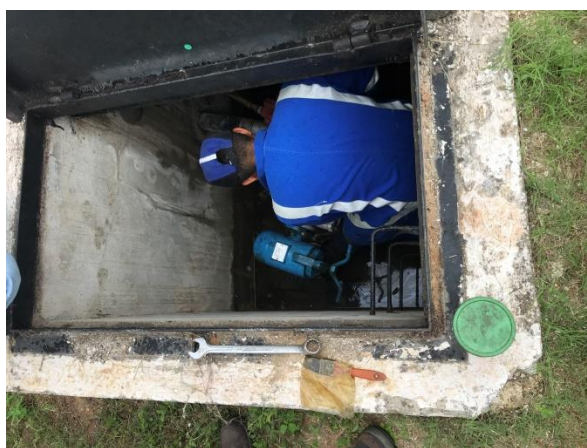
Figure 7: Representante da concessionária realizando a inspeção.