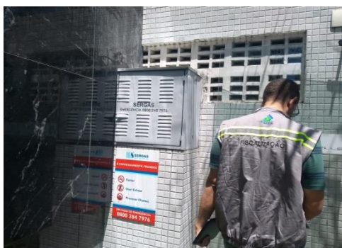
Figura 3: Inspeção