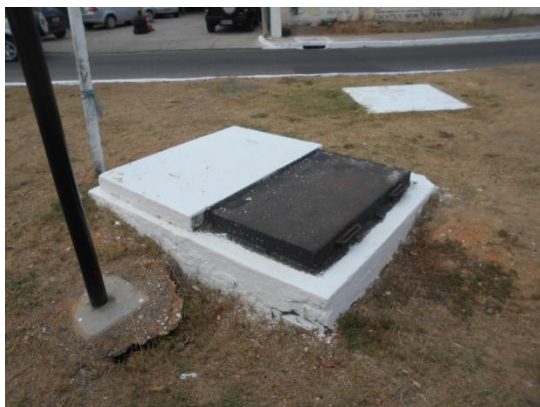
Figura 5: ERP Aeroporto

As figuras 5 a 7 ilustram as atividades realizadas durante a fiscalização: