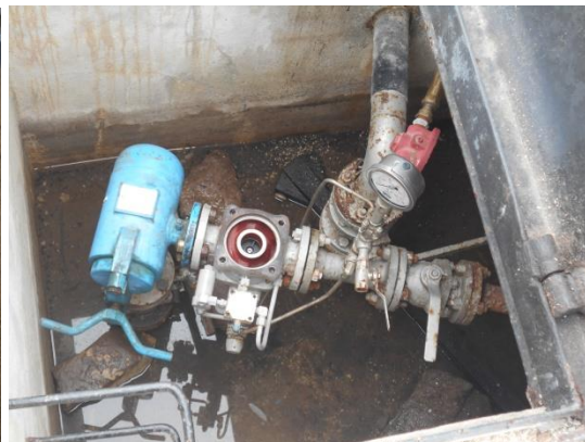
Figura 6: Estação subterrânea